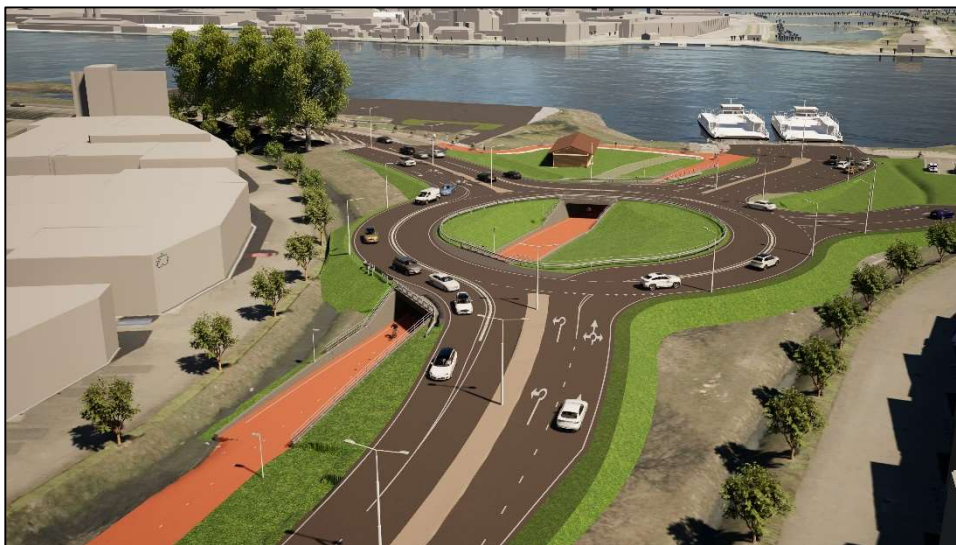
Afbeelding 1: weergave turborotonde incl. fietstunnel

Een vlotte en veilige doorstroming van het verkeer in Westpoort rondom het Hempontplein is belangrijk, gelet op verkeersdrukke. Dagelijks maken veel fietsers, (vracht)verkeer en voetgangers gebruik van dit gebied. Om de verkeersveiligheid te verbeteren en de verkeersdoorstroming te bevorderen, bouwen we hier een turborotonde inclusief fietstunnel. De bouw van deze rotonde en fietstunnel start op 22 maart 2024. Door middel van deze brief informeren wij u over de werkzaamheden, geluidsrijke momenten en de impact die dit heeft op de bereikbaarheid.